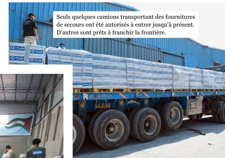
Seuls quelques camions transportant des fournitures de secours ont été autorisés à entrer jusqu'à présent. D'autres sont prêts à franchir la frontière.

Pour intensifier l'aide humanitaire, un financement supplémentaire est indispensable !