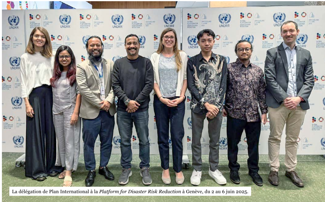
La délégation de Plan International à la Platform for Disaster Risk Reduction à Genève, du 2 au 6 juin 2025.