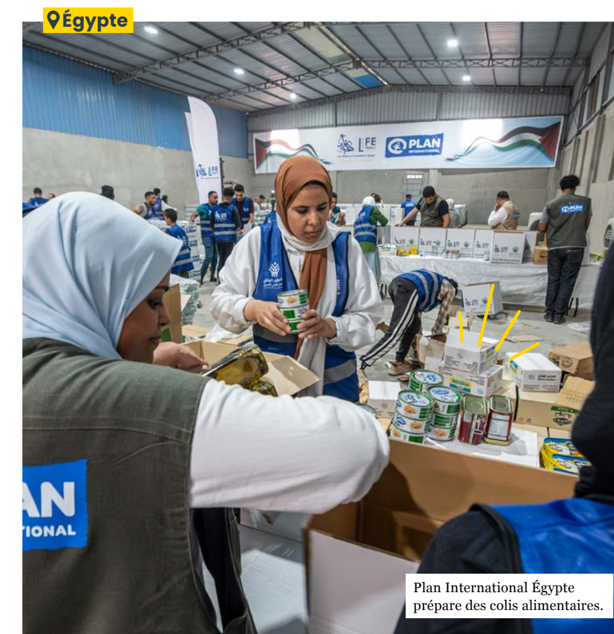
Plan International Égypte prépare des colis alimentaires.